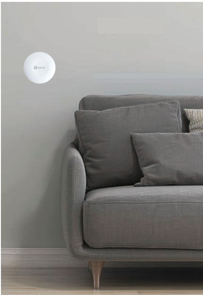
그림 2. 원하는 곳에 붙이기