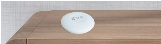
그림 1. 테이블 위에 올려 놓기